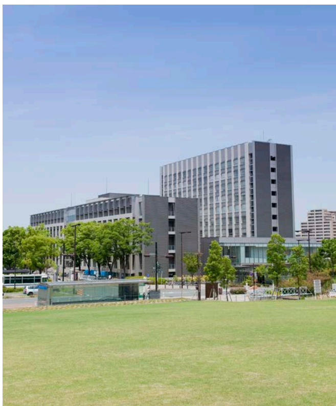
名古屋大学 東山キャンパス (IB 電子情報館)